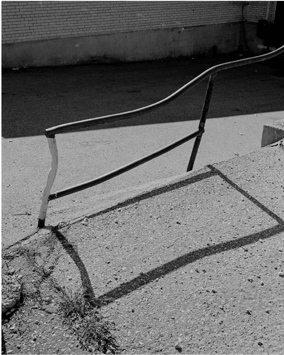
Constanza Bravo Granadino ( @bravogranadino )