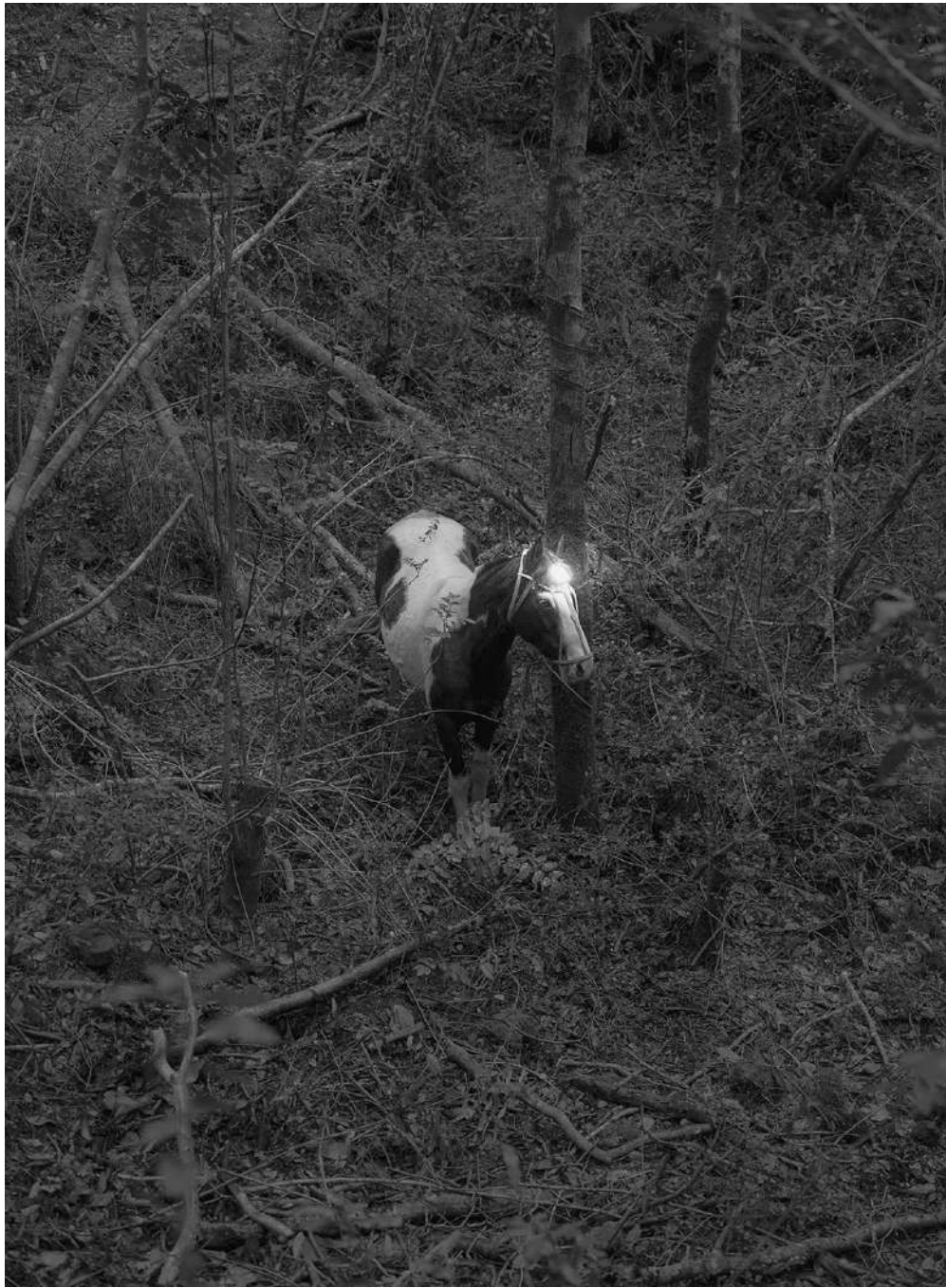
Paz Olivares-Droguett ( @pazolivaresdroguett )