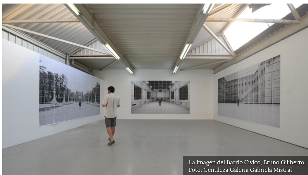
La imagen del Barrio Cívico, Bruno Giliberto

Es por ello que en esta exposición se buscará activar y materializar la interacción de la gente con las imágenes del Barrio Cívico de la capital, además de participar de una suerte de liberación y catarsis en la galería, ubicada dentro de las inmediaciones del Ministerio de Educación.