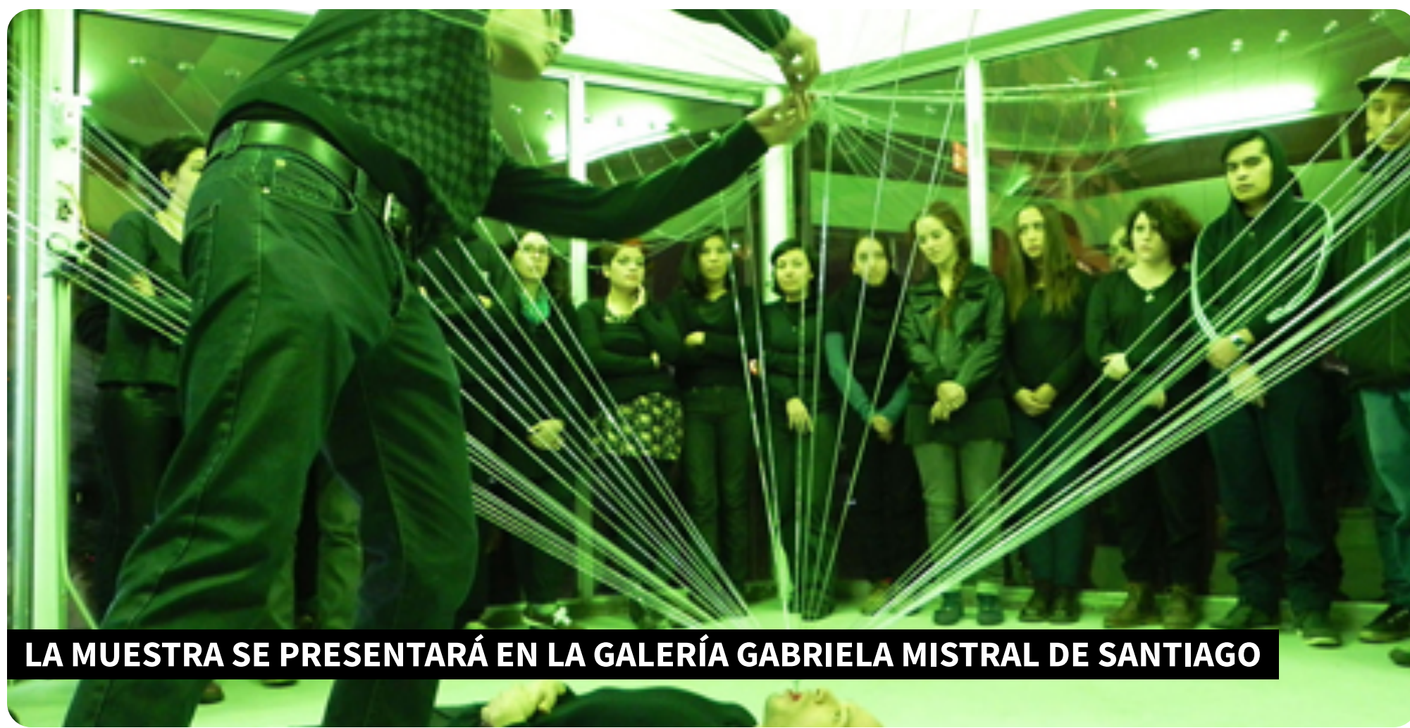
LA MUESTRA SE PRESENTARÁ EN LA GALERÍA GABRIELA MISTRAL DE SANTIAGO